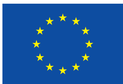
UNIONE EUROPEA Fondo Europeo di Sviluppo Regionale